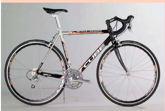
Top-Rennrad Typ 1 Shimano Ultegra 10-fach