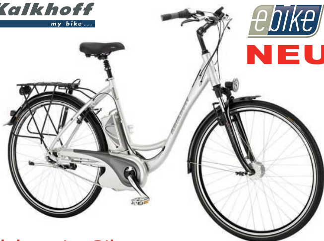
Elektronic - Bike

Kalkhoff Aggattu Pedalec mit Tretkraftverstärker