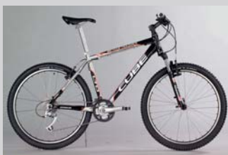
Mountainbike Fully oder Hard - Tail CUBE LTD, Rock - Shox Dart 3, Shimano XT